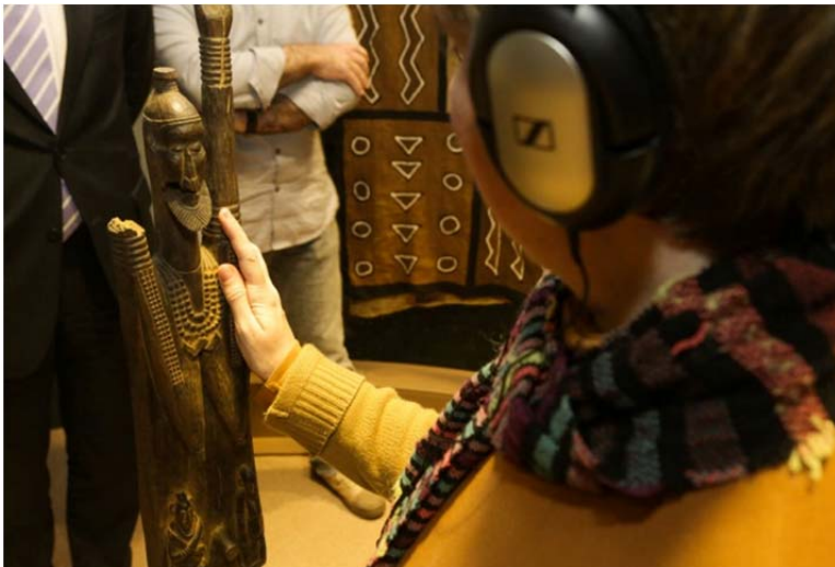
Découverte tactile et sonore de la Djennéke

La 2 ème édition de la SEMAINE DE L'ACCESSIBILITE s'est achevée le vendredi 7 décembre par le concert des musiciens maliens non-voyants Amadou et Mariam, clôturant ainsi de manière festive et musicale une semaine placée sous le signe de la mixité, de l'intégration et du partage, dédiée à tous les types de handicap.