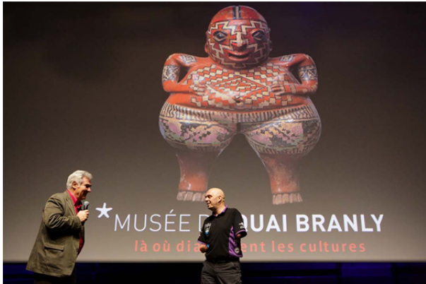
leçon de vie Georges Pernoud et Philippe Croizon